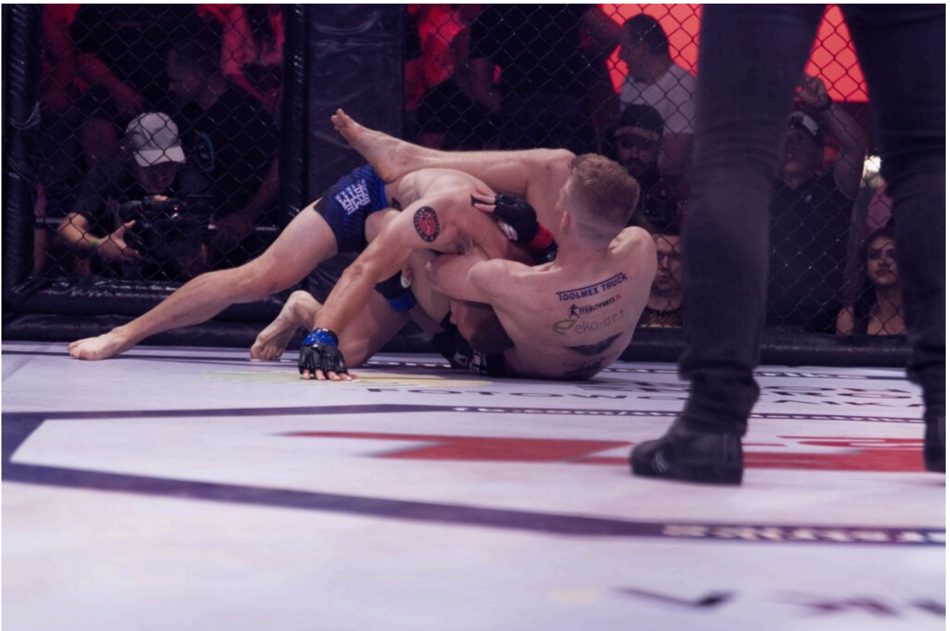
Facebook Thunderstrike Fight League