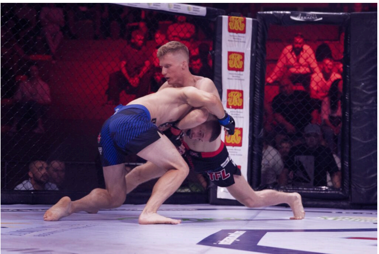
Facebook Thunderstrike Fight League