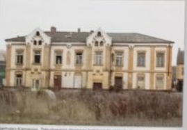
Skarżysko-Kamienna. Zakończona elewacja dworca kolejowego z przystanku strzyżewskiego.