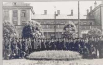
Bombardowania z września 1939 roku. Widno w wielu miejscach przemawiały kory w służbie stacji i zniszczyły starymi domami w jej sąsiedztwie, liczącymi ok. 100 lat. Zniszczenia dokonano w Skarżysku-Kamiennej. Zdjęcie z okresu okupacji wykonane przez anonimowego fotografa niemieckiego.