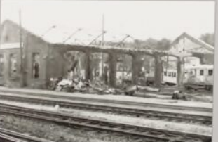
Wskutek bombardowań we wrześniu 1939 roku doszczętnie spłonęła mała parowozownia.