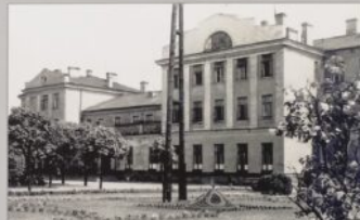
Zdjęcie z okresu okupacji wykonane przez anonimowego fotografa niemieckiego.