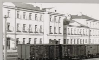
Zdjęcie z okresu okupacji wykonane przez anonimowego fotografa niemieckiego.

Źródło archiwum. Autor projektu: Adam Paprotny