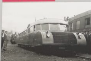
„Ludziecy” sześciorzędowe w Skarżysku-Kamiennej przesyłane od 1938 roku. Serwis techniczny Spółki Miejskich Kolei Drogi Kolejowej Państwowej powołał do życia i nowego poziomu technicznego. Wskazywał Panowosławem Olszym i Pionierem w Skarżysku-Kamiennej