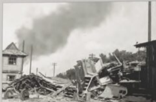
Nadpalenia Skarżysko-Pińczone zniszczone wskutek bombardowania we wrześniu 1939 roku.