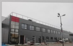
17-11-2022. Skarżysko-Kamienna. Budowa kompleksu utrzymaniowego taboru kolejowego spółki POLREGIO.