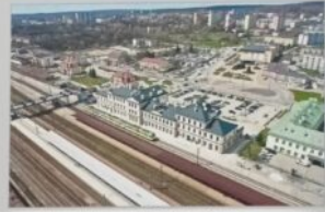
Skarżysko-Kamienna. Widok współczesny.