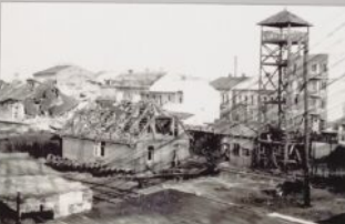
Wieża obserwacyjno-miernicza obrony przeciwlotniczej służyła na obronę lotniska kolejowego przy ulicy Towarowej.