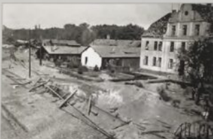
Wskutek bombardowań we wrześniu 1939 roku doszczętnie spłonęła mała parowozownia.