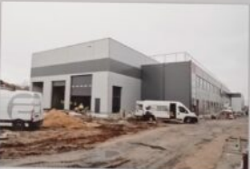
17-11-2022. Skarżysko-Kamienna. Budowa kompleksu utrzymaniowego taboru kolejowego spółki POLREGIO.