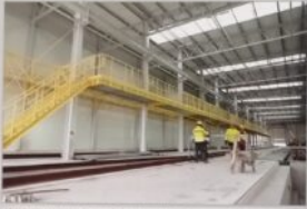
17-11-2022. Skarżysko-Kamienna. Budowa kompleksu utrzymaniowego taboru kolejowego spółki POLREGIO.