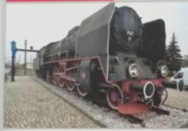
Skarżysko-Kamienna. Zabytkowy parowóz P44T-12 obok dworca kolejowego.