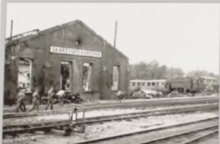
Duży parowozownia wachlarzowa zniszczone wskutek bombardowań we wrześniu 1939 roku.