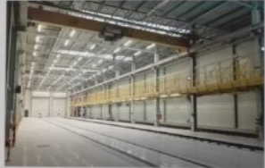
20-03-2023. Skarżysko-Kamienna. Budowa kompleksu utrzymaniowego taboru kolejowego spółki POLREGIO.