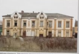
Skarżysko-Kamienna. Zakończona dawna kolejowa zajezdnia strażnicza.