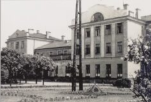
Zdjęcie z okresu okupacji wykonane przez anonimowego fotografa niemieckiego