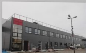
17.11.2022. Skarżysko-Kamienna. Budowa kompleksu utrzymaniowego taboru kolejowego spółki POLREGIO.