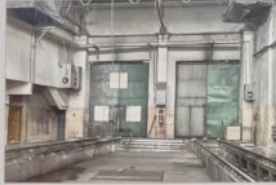
Skarżysko-Kamienna. Zakończona część skomodyfikowanego peronu oraz spalinowozów i awaryjnego kolektorów.