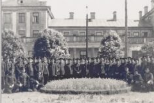
Bombardowania z września 1939 roku, widno w wielu miejscach przemawiały kory w służbie stacji i zniszczyły starymi domów w jej sąsiedztwie, uczyniła omiary budynek dawna kolejowego w Skarżysku-Kamiennej. Zdjęcie z okresu okupacji wykonane przez anonimowego fotografa niemieckiego.