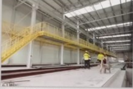
17.11.2022. Skarżysko-Kamienna. Budowa kompleksu utrzymaniowego taboru kolejowego spółki POLREGIO.