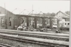
Wskutek bombardowań we wrześniu 1939 roku doszczętnie spłonęła mała parowozownia