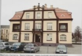
Skarżysko-Kamienna. Budynek kamienicy - dawny budynek dyrekcji kolejowej.