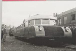
„Ludziecy” sześciorzędowe w Skarżysku-Kamiennej przesyłane od 1938 roku. Serwis techniczny Spółki Miejskich Kolei Miejskiej Dyrekcja Naczelna PKP powołała do życia z odwołaniem do nowego poziomu technicznego. Wskazywał Panowosław Główny i Pionierzyści w Skarżysku-Kamiennej