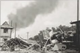
Nadziałania Skarżysko Pińskone zniszczone wskutek bombardowania we wrześniu 1939 roku.