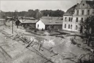
Wskutek bombardowań we wrześniu 1939 roku doszczętnie spłonęła mała parowozownia