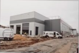
17.11.2022. Skarżysko-Kamienna. Budowa kompleksu utrzymaniowego taboru kolejowego spółki POLREGIO.