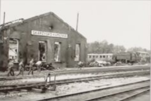
Duży parowozownia wachlarzowa zniszczone wskutek bombardowań we wrześniu 1939 roku