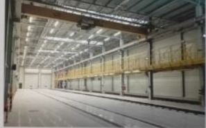
20.03.2023. Skarżysko-Kamienna. Budowa kompleksu utrzymaniowego taboru kolejowego spółki POLREGIO.