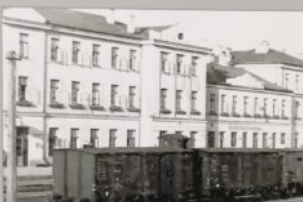
Zdjęcie z okresu okupacji wykonane przez anonimowego fotografa niemieckiego